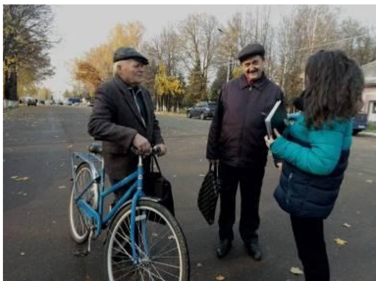
Опрос местных жителей октябрь 2017