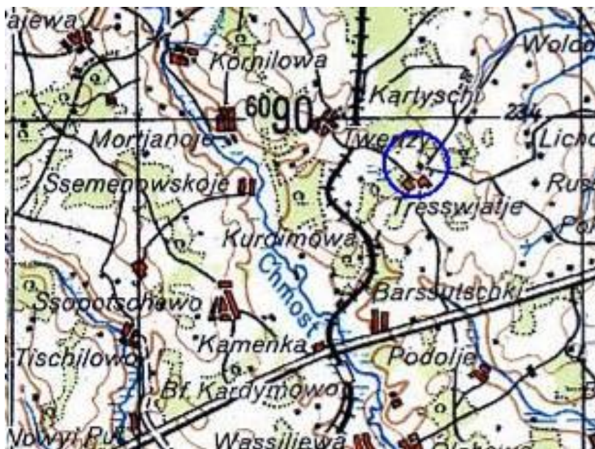
Немецкие военные карты второй мировой войны онлайн. Европейская часть СССР. Трехкилометровка.