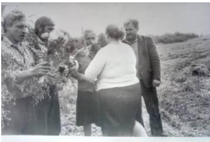
Поздравление с окончанием жатвы. 1967г

Фото сделанные в ходе работы над проектом.