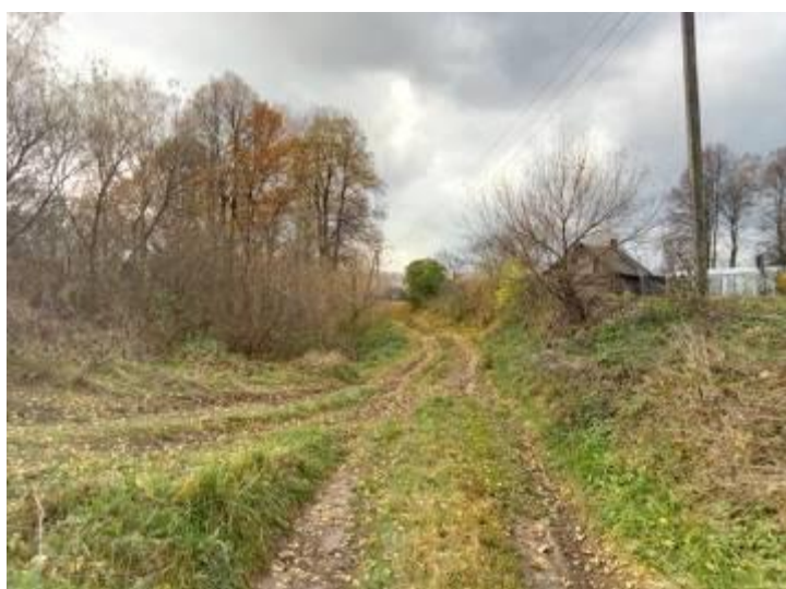
Д. Курдимово октябрь 2017