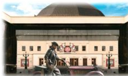
Цирк им. Никулина