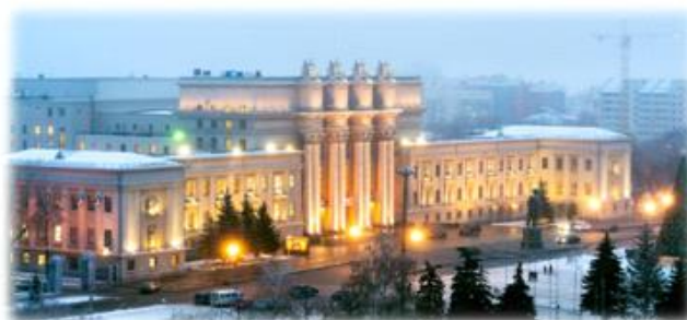
Театр оперы и балета