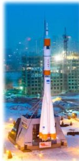
"МВЦ "Самара Космическая"