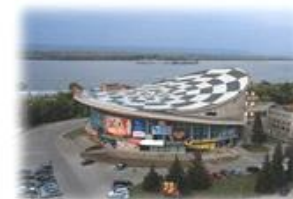
Цирк им. Олега Попова