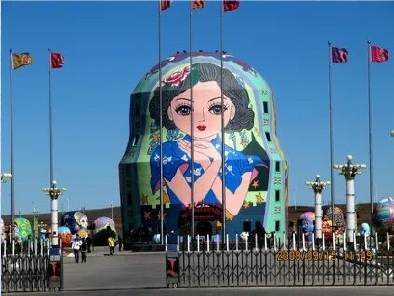
Самая большая в мире 30- тиметровая Матрёшка в Маньчжурии (Китай, парк матрёшек)