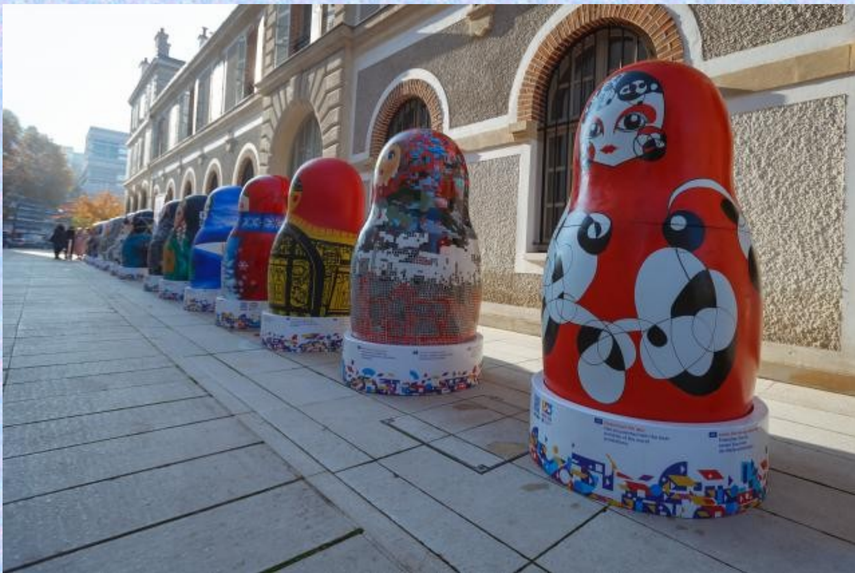
Матрёшки на выставке в Париже в 1900 году