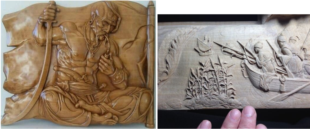
Образ казака в резьбе по дереву.

Предварительно рисуется эскиз композиции на бумаге в размер рельефа. Самое главное – каждый ребенок лепить свою композицию в рамках данной темы и одинаковых шаблонов или повторов здесь не может быть.