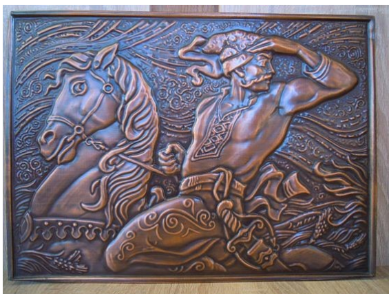
Образ казака в чеканке.