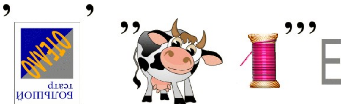
Схема решения задания 1

Решение задачи 1 является паролем для архива A2, решение задачи 2 – пароль для A3 и т.д., решение задачи A5 – пароль к архиву ключ.