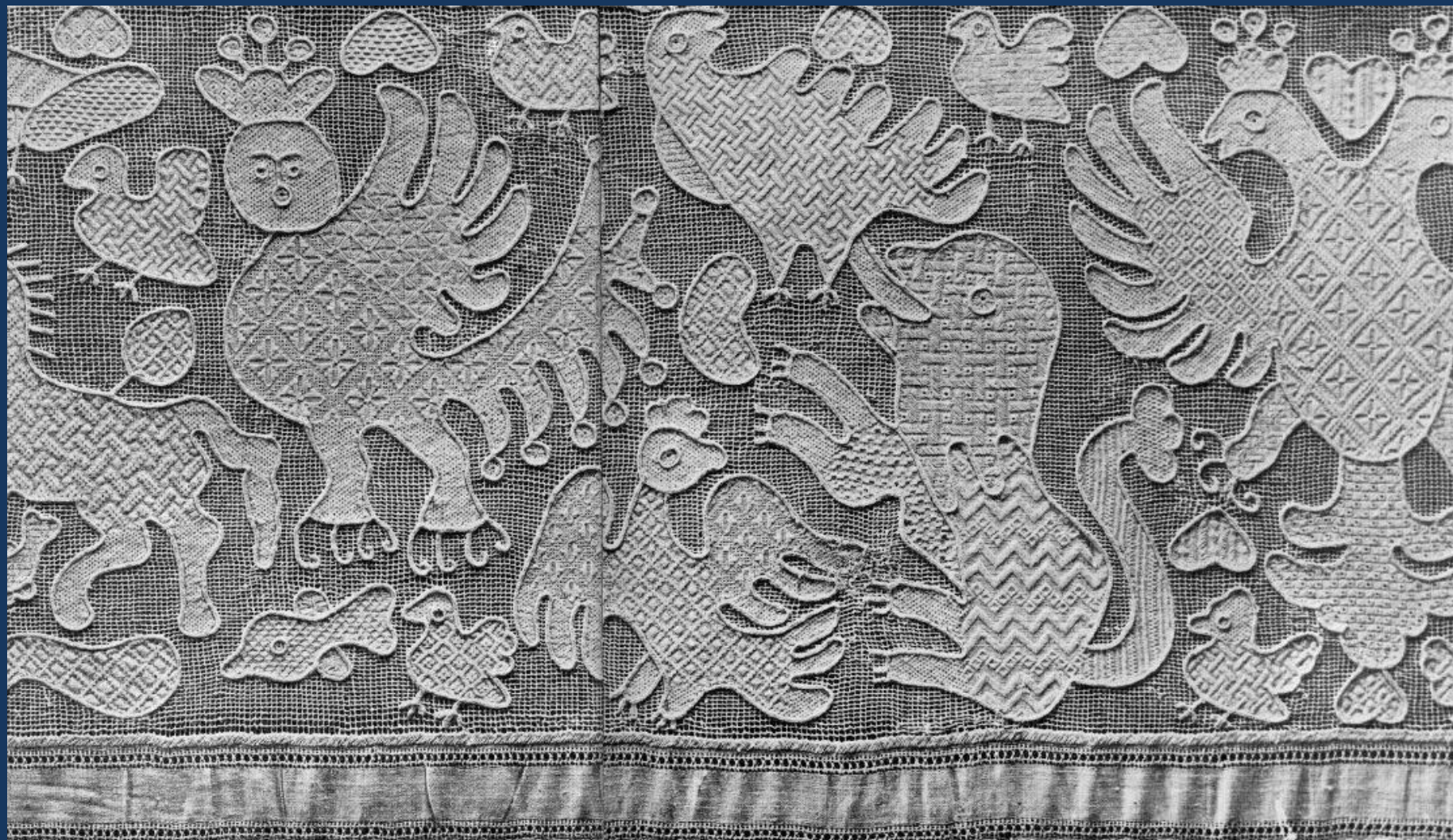
XVIII в. Вологодская губерния. Вышивка строчкой по письму льняными нитями по льняному полотну. Деталь.