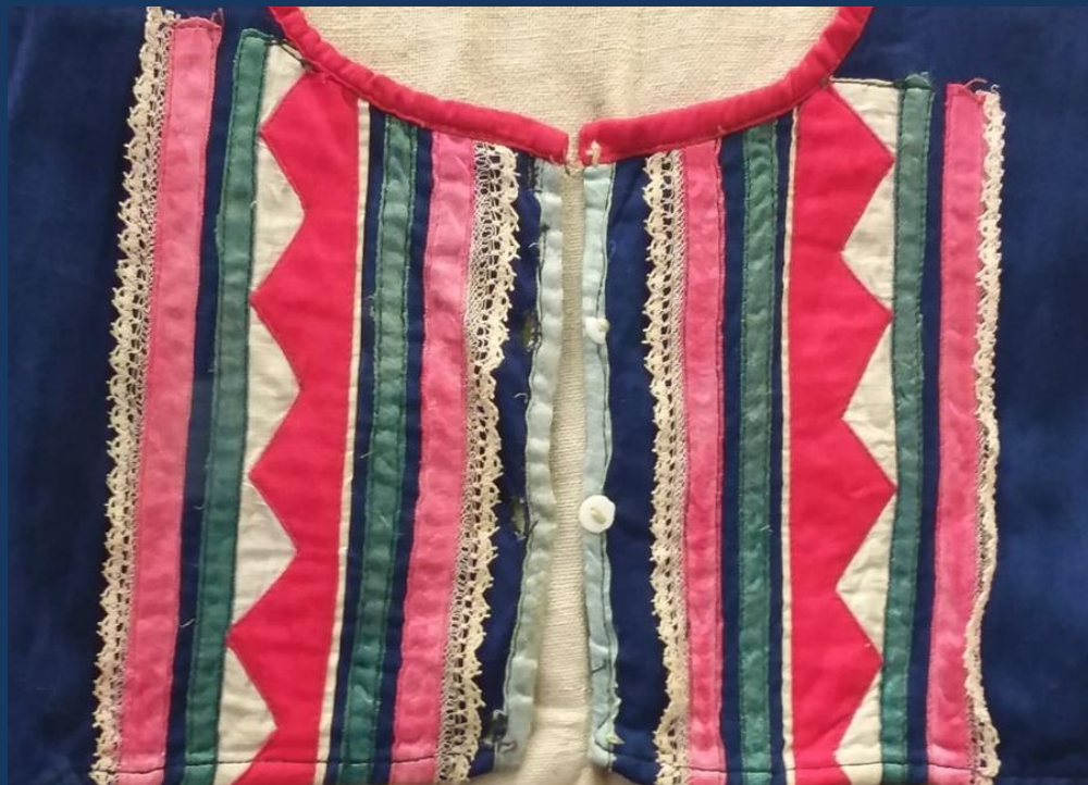
Фрагмент безрукавки лоскутное шитье