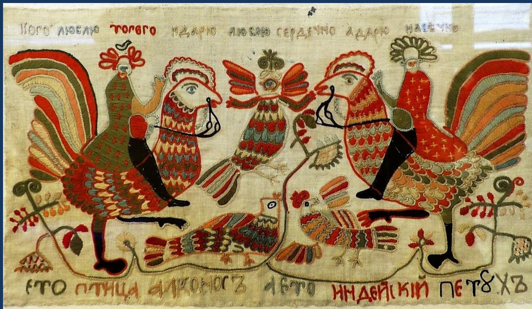
Фрагмент полотенца середина XIXв. Кострома