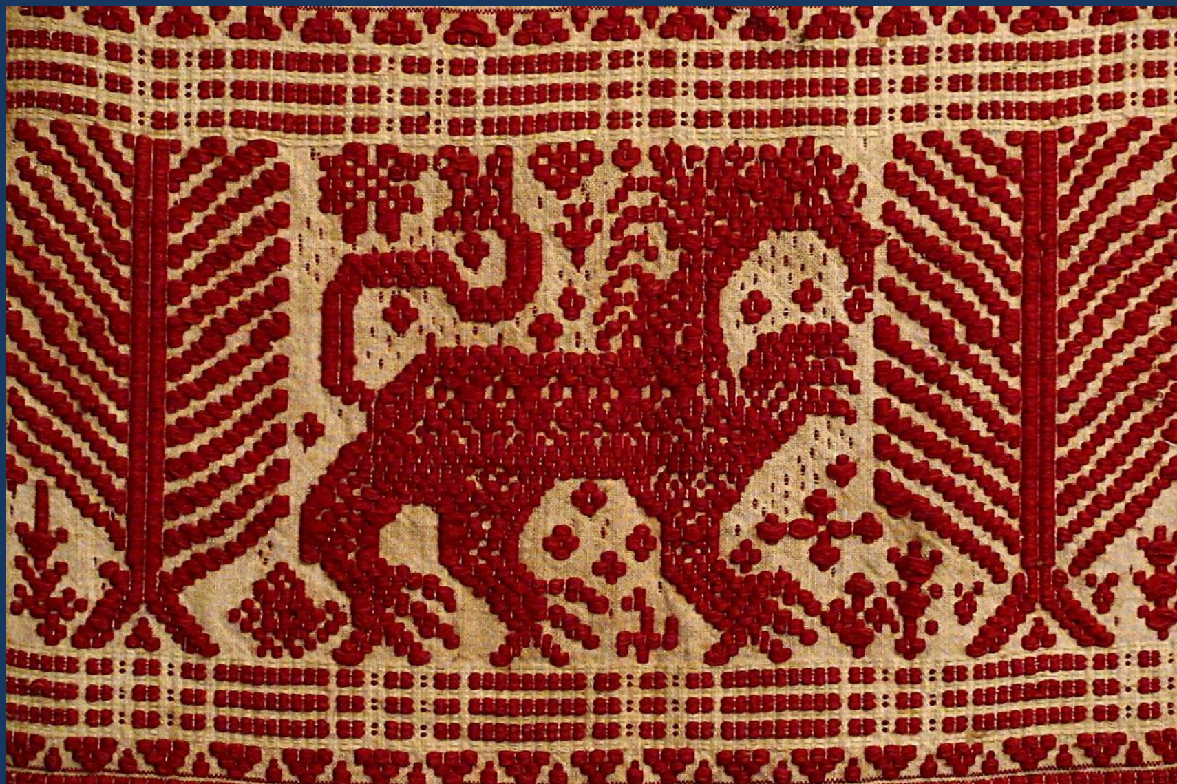
Фрагмент зооморфного орнамента исполненного в технике ручного ткачества на станке.