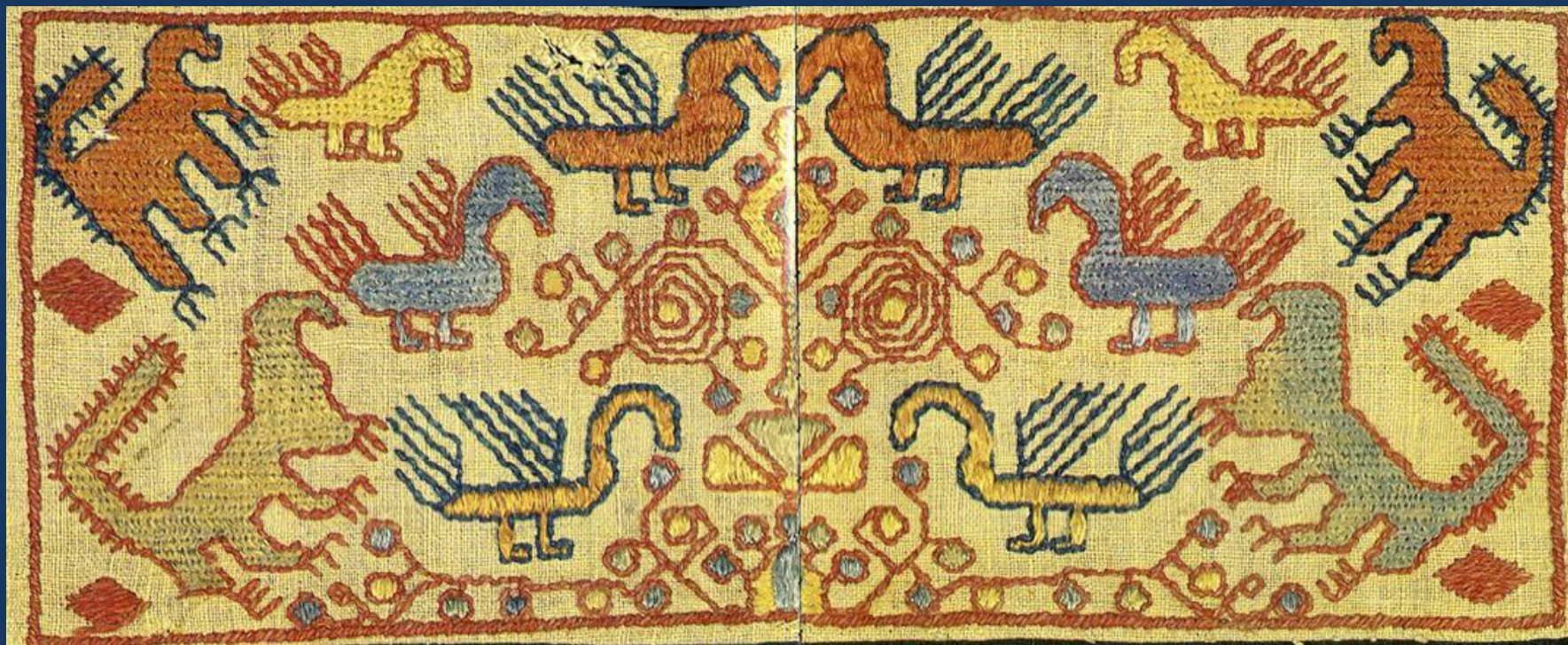
Павы – птицы и львы у древа жизни на оплечье олонецкой рубахи