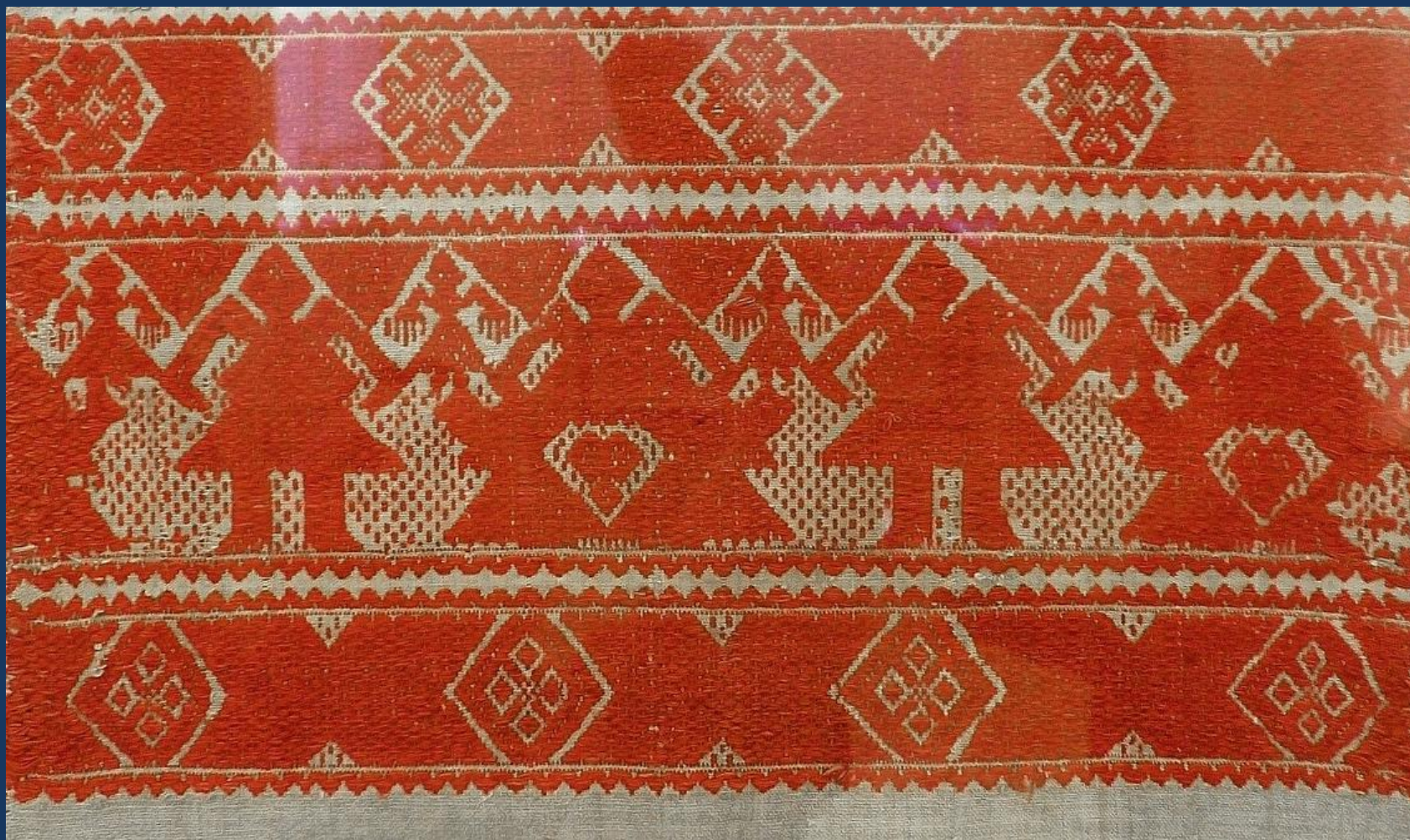
Конец полотенца техника ручного ткачества на станке. Вологодская губ.