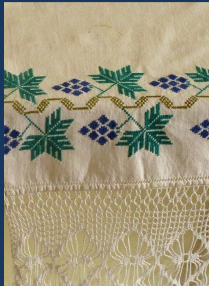
Вышивка полотенец крестом Курская губ.