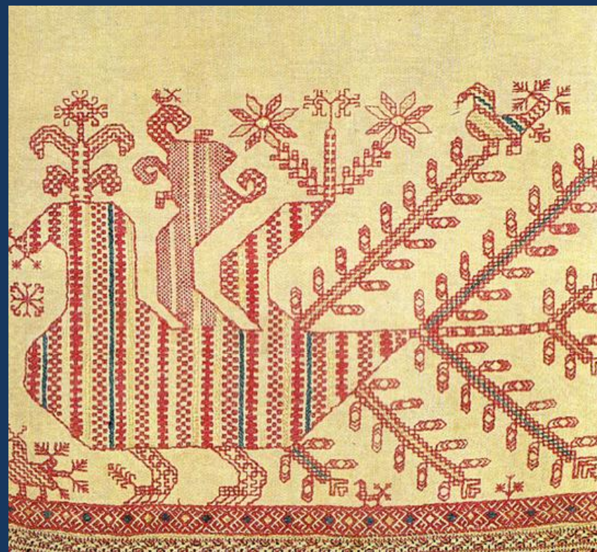
Павы — Птицы с каргопольских женских рубах Архангельской губернии