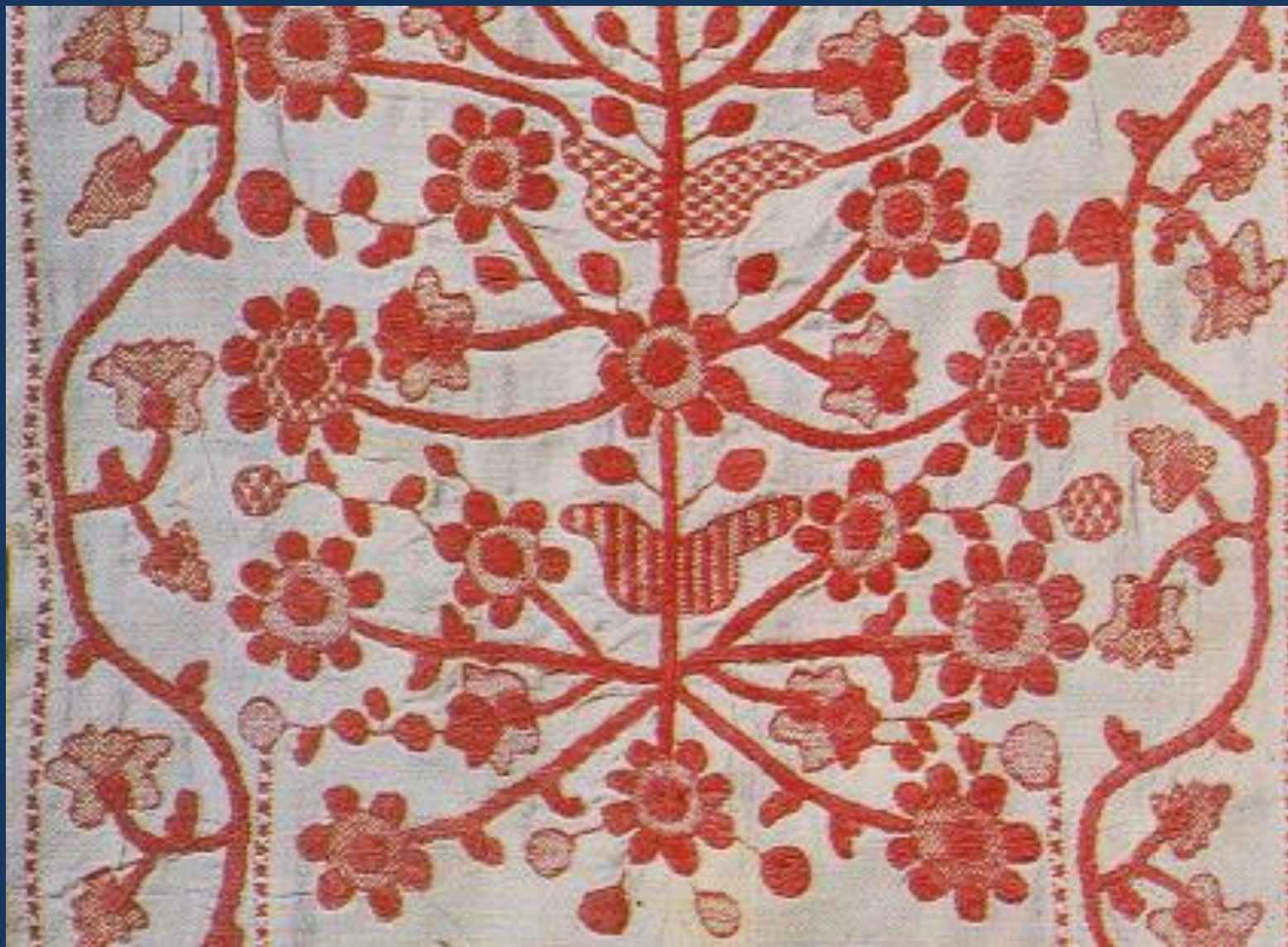
Рушник с растительными мотивами полтавской вышивки