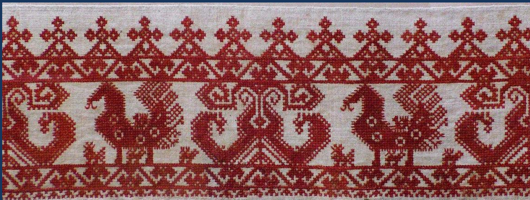
Образцы растительного орнамента. Наподольницы.