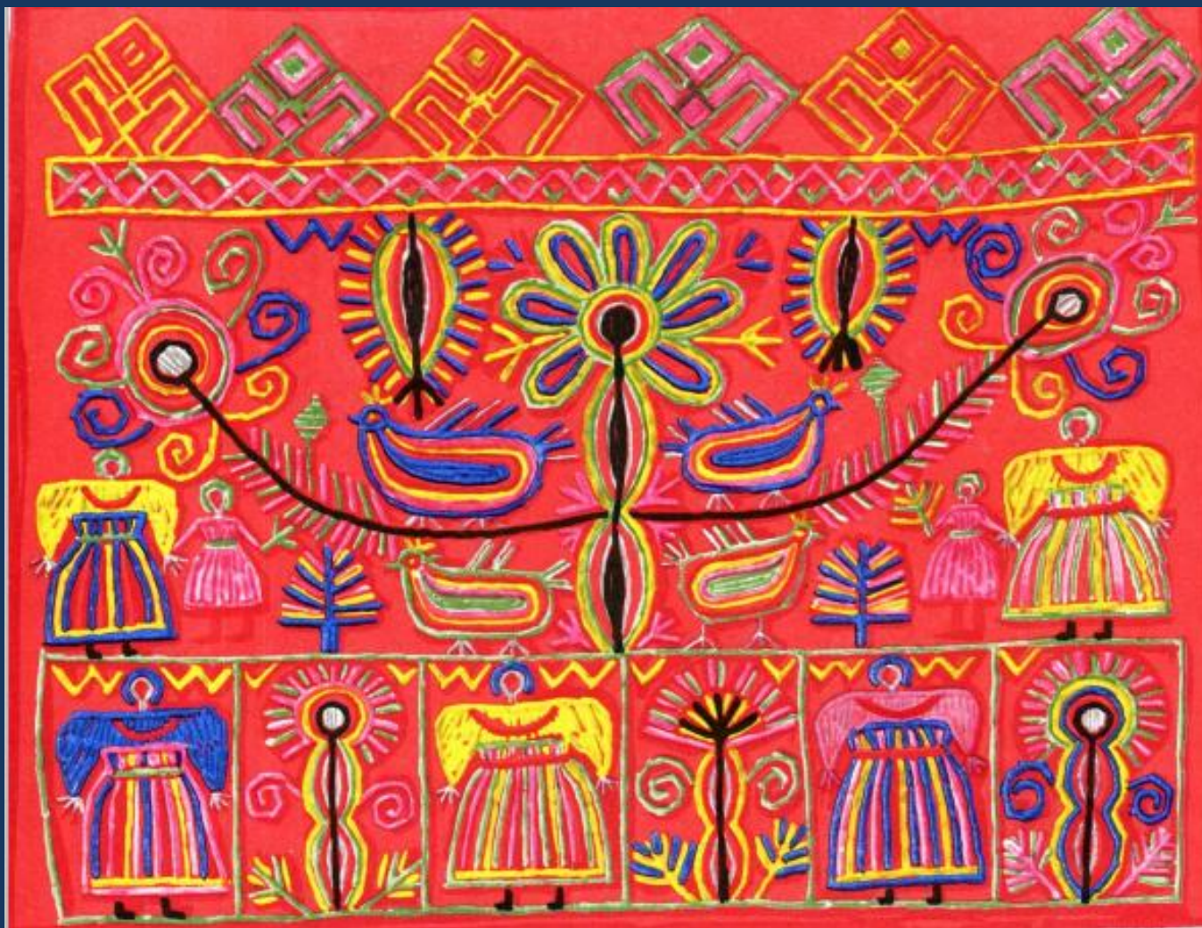
Фрагмент свадебного полотенца – занавеса д. Федоровское Перская вол. Устюжский у. замкнутая орнаментальная композиция