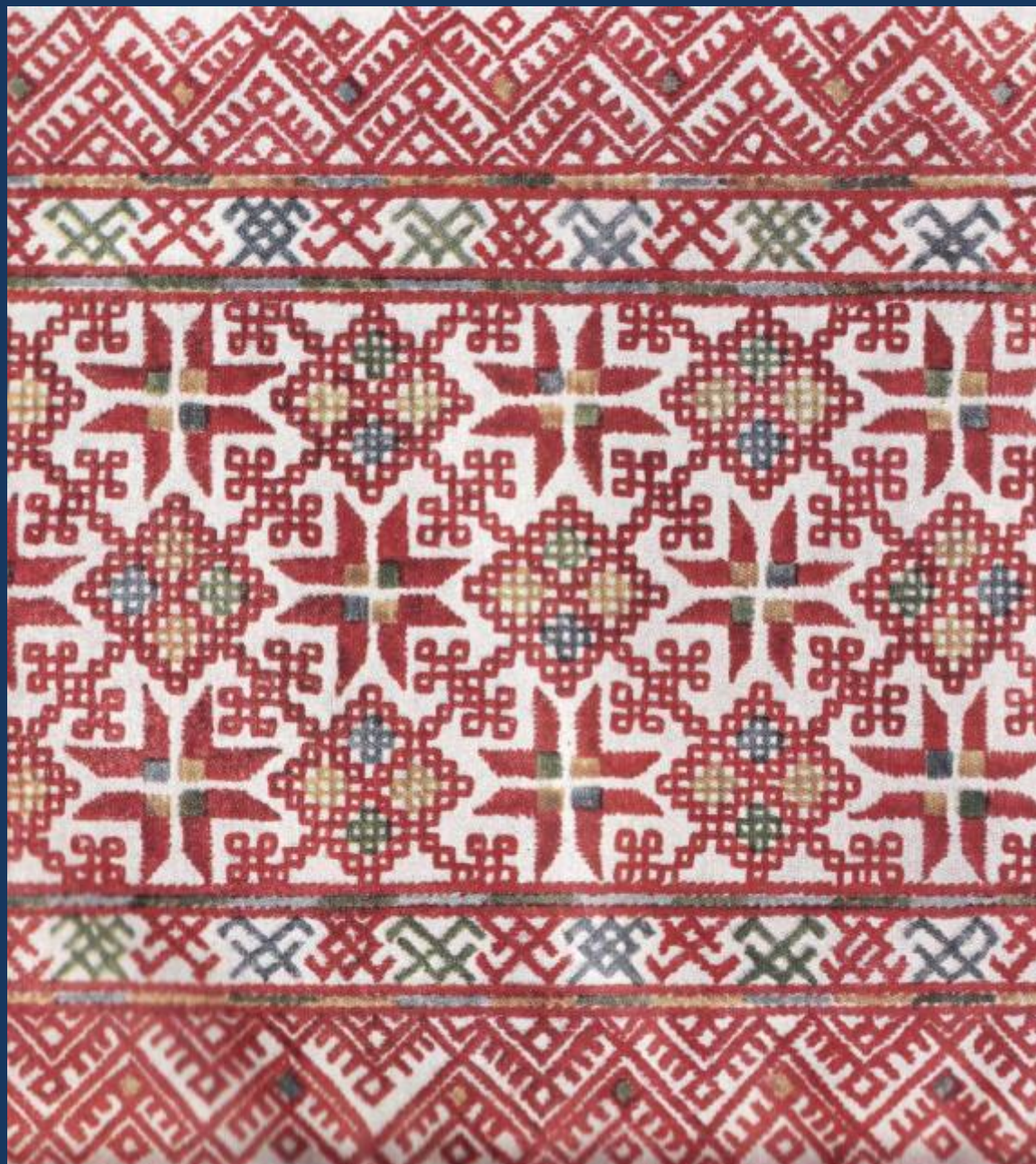
Фрагмент вышивки оплечья рубахи с геометрическим орнаментом Каргопольский район