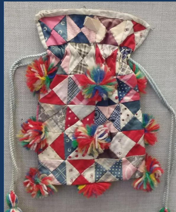
Кисет лоскутное шитье