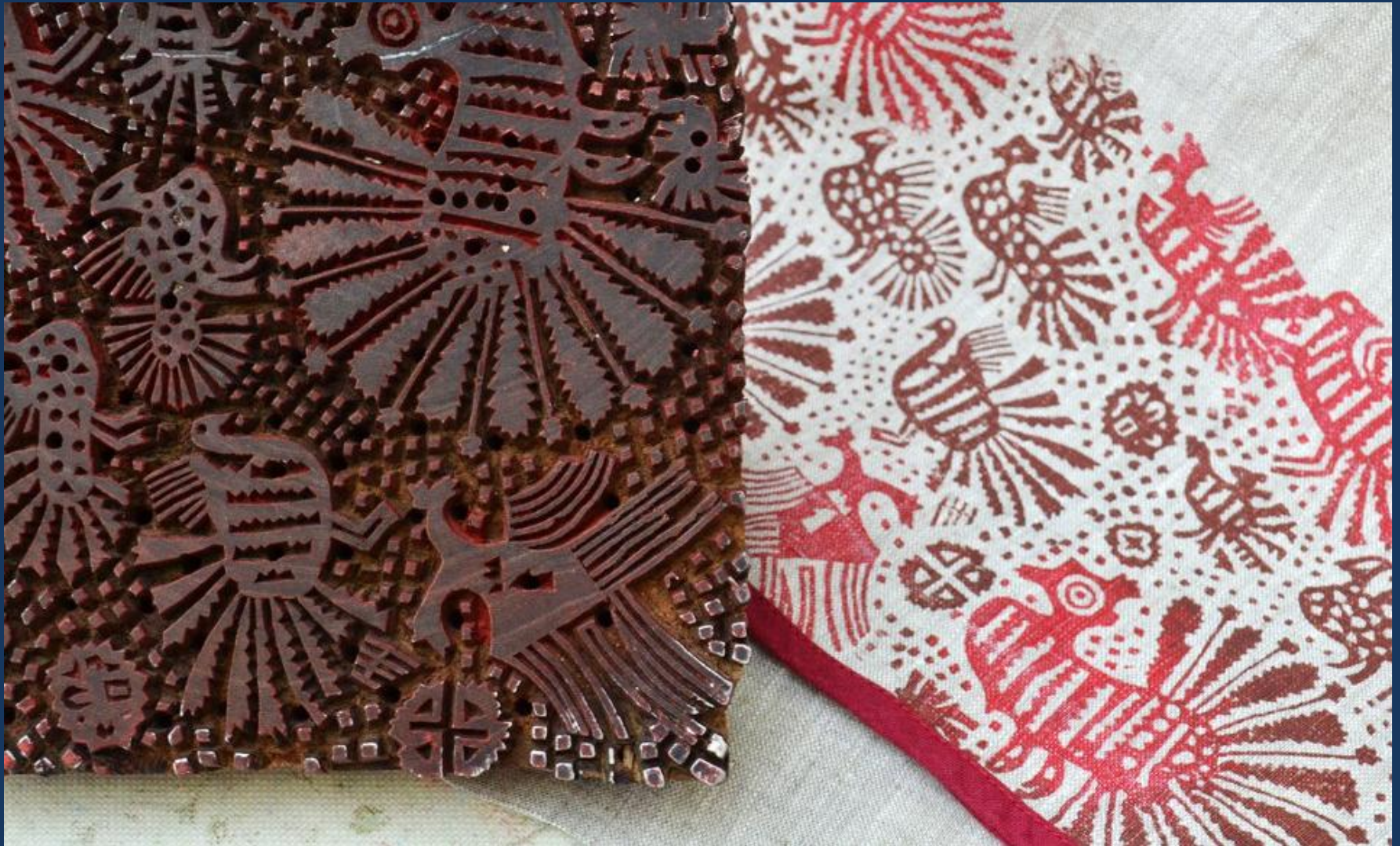
Фрагмент ткани в технике верховой набойки и набоечной доски с выпуклым штампом.