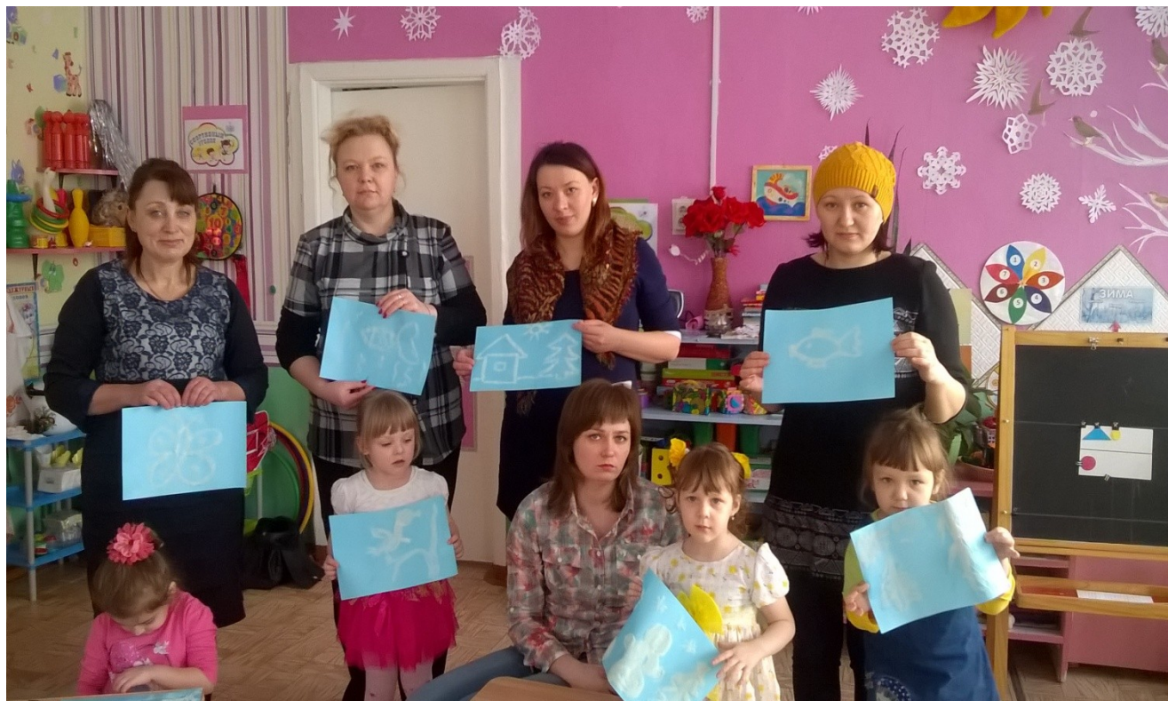
Родители представляют свой мастер-класс « Рисование манкой»