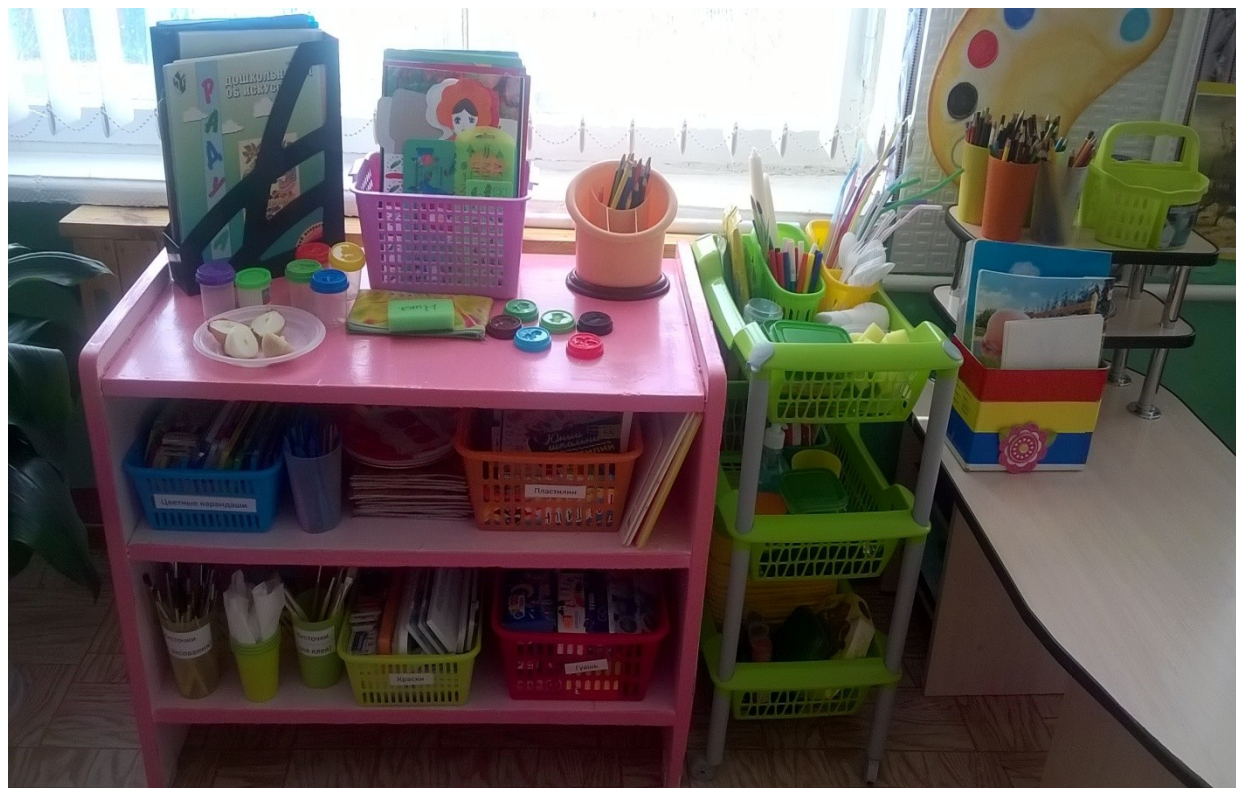
Наш уголок для творчества