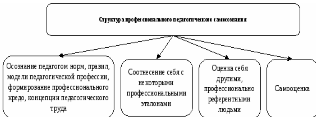
Рис. 1. Структура профессионального педагогического самосознания

Ученые В.А. Мижериков и Т.А. Юзефовичус полагают, что будущий педагог должен уметь выявлять у себя наличие этих образований на том или ином этапе профессионального становления, намечать пути и средства развития положительных качеств и нейтрализации и вытеснения отрицательных) [17].